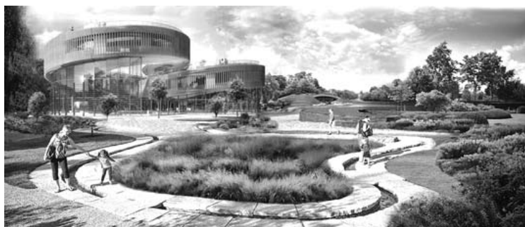
Štai taip studentai įsivaizduoja sveikatingumo sodus Anykščiuose.

Išrinkti geriausi architektūrinio konkurso „Išmanusis miestas V“ dalyvių darbai. Antrosios vietos laimėtoja paskelbta KU komanda, Anykščiams sukūrusi progresyvią priešprojektinį pasiūlymą, kokio neturi nė vienas miestas visame pasaulyje. Projektas pavadintas „Sveikatingumo sodai“.