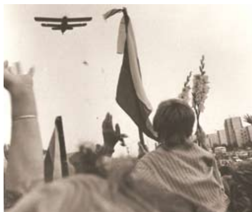
Fotomenininko Vytauto Janulio objektyvu užfiksuoti Baltijos kelio vaizdai.