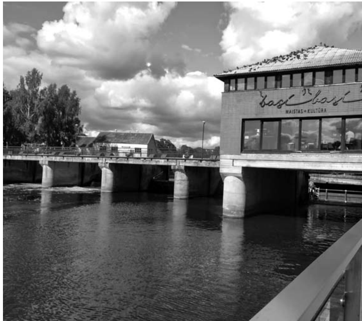
Anykščių Šventosios upės užtvanka yra vienas iš miesto simbolių.

Šių metų kovo mėnesį buvo trūkęs Šventosios upės užtvankos šliuzo skląstį laikantis trosas.