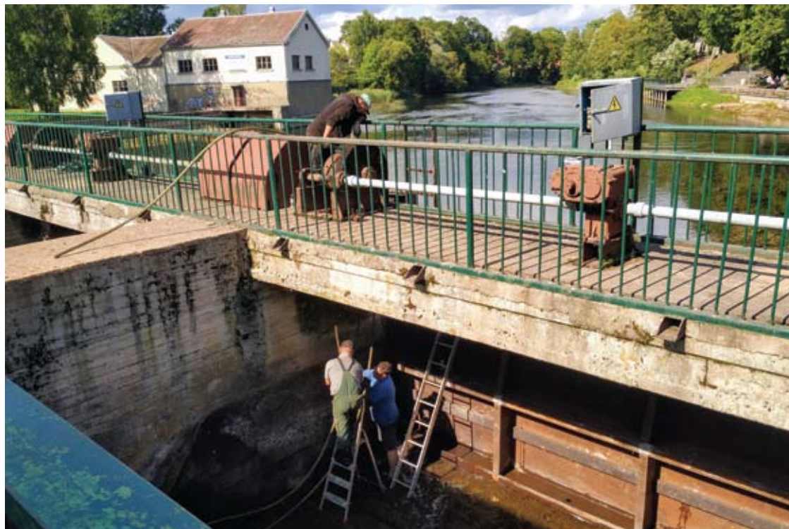
Šventosios upės užtvankos trosai keičiami naujais, nes jie yra avarinės būklės.

Robertas ALEKSIEJŪNAS robertas.a@anyksta.lt