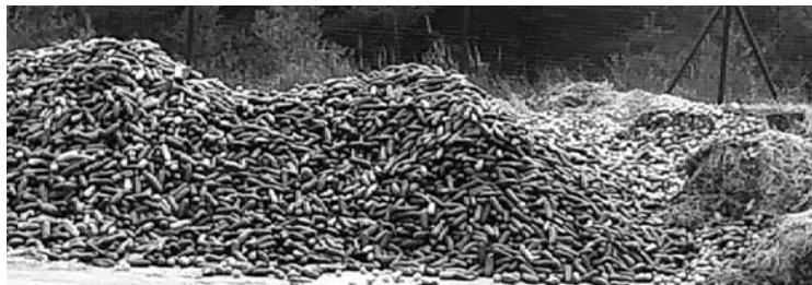
Žaliųjų atliekų kompostavimo aikštelėje pamatyti vaizdai gyventojus ir stebina, ir pikntina.

Anykščių seniūnijos Šeimyniškių kaime, UAB Anykščių komunalinis ūkis priklausančioje žaliųjų atliekų kompostavimo aikštelėje, pūso kalnai agurkų. Po to, kai ši nuotrauka buvo paviešinta socialiniuose tinkluose, žmonės prisipažino negalintys patikėti, kad gali būti išmetami tokie didžiuliai kiekiai žemės ūkio produkcijos, bei svarstė, ar negalima būtų agurkus, pavyzdžiui, padovanoti vaikų ar senelių namams.